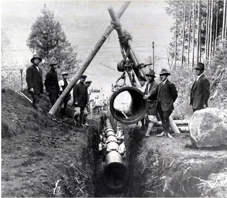
八景水谷送水管布設工事（大正期）